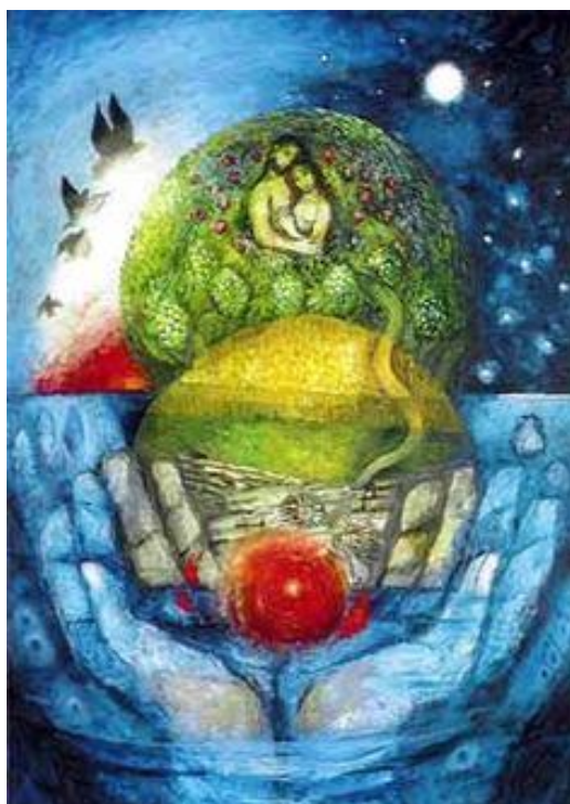
Sieger Köder 1

Salmo 139,14 – Motto biblico agosto 2020